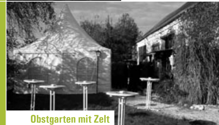
Obstgarten mit Zelt

Widmen Sie sich als perfekter Gastgeber ganz Ihren Gästen - wir kümmern uns um den Rest!